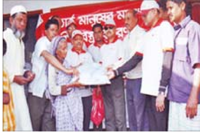
শীতর্ত মানুষের মাঝে কম্বল বিতরণ কর্মসূচিতে ওয়ান ব্যাংক লিমিটেড ৭.৫০ লক্ষ টাকার ৩,০০০ পিস কম্বল বিতরণ করে

ওয়ান ব্যাংক লিমিটেড কর্তৃক কর্পোরেট সামাজিক দায়বদ্ধতার ধারাবাহিক কর্মকাণ্ডে সম্পৃক্ত থাকার অংশ হিসেবে ‘শীতর্ত মানুষের মাঝে কম্বল বিতরণ’ কর্মসূচিতে নোয়াখালী ও গোকুল (বগুড়া) অঞ্চলের শীতর্ত মানুষের মাঝে কম্বল বিতরণ করা হয়। কম্বল বিতরণের মাধ্যমে দুস্থ মানবতার কল্যাণে সামান্য হলেও